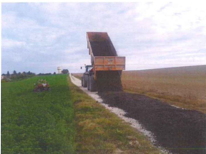
Dans notre recherche du matériau peu onéreux permettant de renforcer les chemins de la commune, la société STP de Feuges a déversé 12 tonnes de mâchefer provenant de la déshydratation d'Assencières.