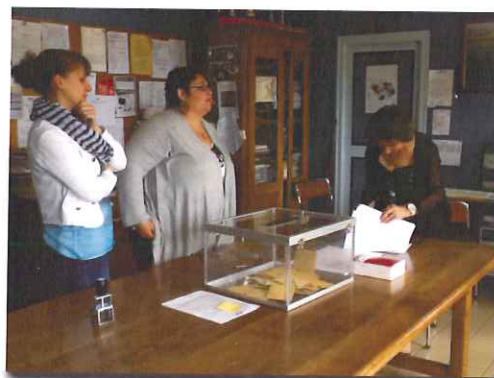
Elections européennes : le bureau de vote à la mode féminine !