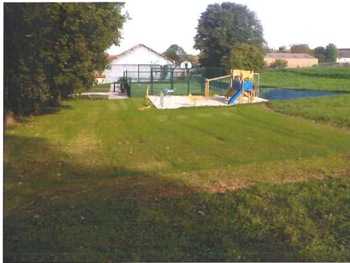
La pelouse semée il y a quelques temps au coeur du village apparaît vigoureusement notamment en raison des fortes précipitations du mois d'octobre.