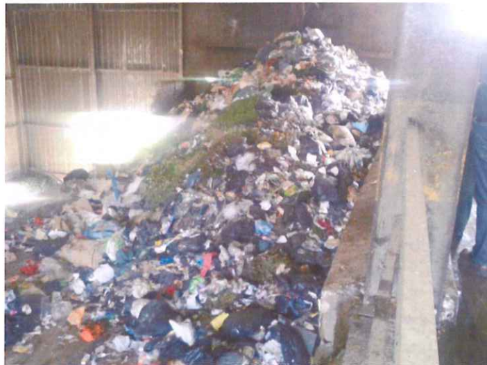
Nos déchets en transit aux Ecrevolles. Ils sont ensuite transportés et déposés dans la commune de Montreuil sur Barse.