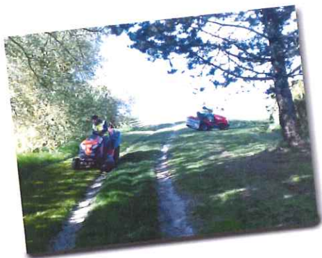
La première tonte des espaces verts en avril.

En ce début de printemps, la société BRM a procédé au balayage des caniveaux du village.