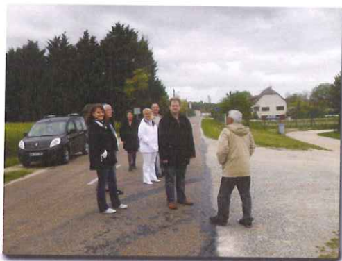
Visite du village par le nouveau conseil municipal