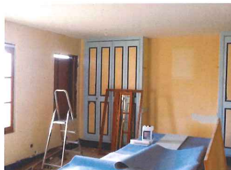
Les travaux de rénovation de la mairie ont débuté début octobre. Durant les 4 semaines nécessaires, les services communaux ont déménagé dans la salle des fêtes. Les 4 fenêtres qui s'étaient affaissées au fil du temps retrouvent leur place grâce à l'intervention d'un maître menuisier. Finis les rafistolages et comblement des fissures qui faisaient courir d'air.